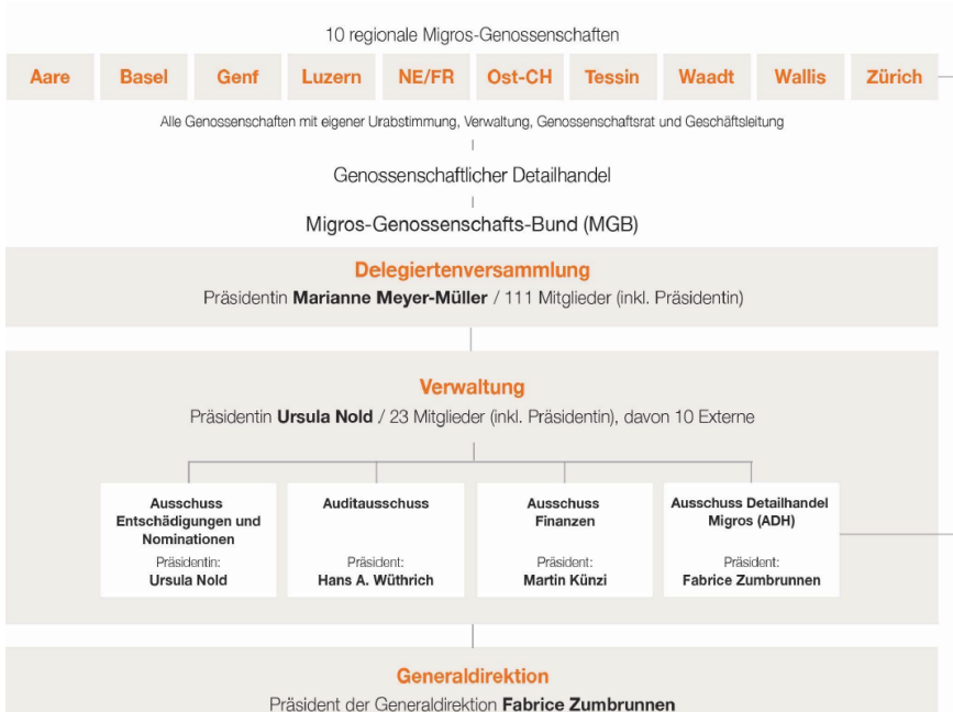
Abb. 3: Die Struktur der Migros 106

recht einzuräumen“ und „vor der Wahl ihres Geschäftsleiters die Genehmigung der MGB-Verwaltung einzuholen“. Zudem verpflichten sich die Genossenschaften „ihre Expansion, Investitionen und deren Finanzierung mit dem MGB abzustimmen“. Neben den statutarischen Regelungen hat der MGB entsprechend ein weitreichendes Prüf- und Überwachungsrecht gegenüber seinen angeschlossenen Genossenschaften.